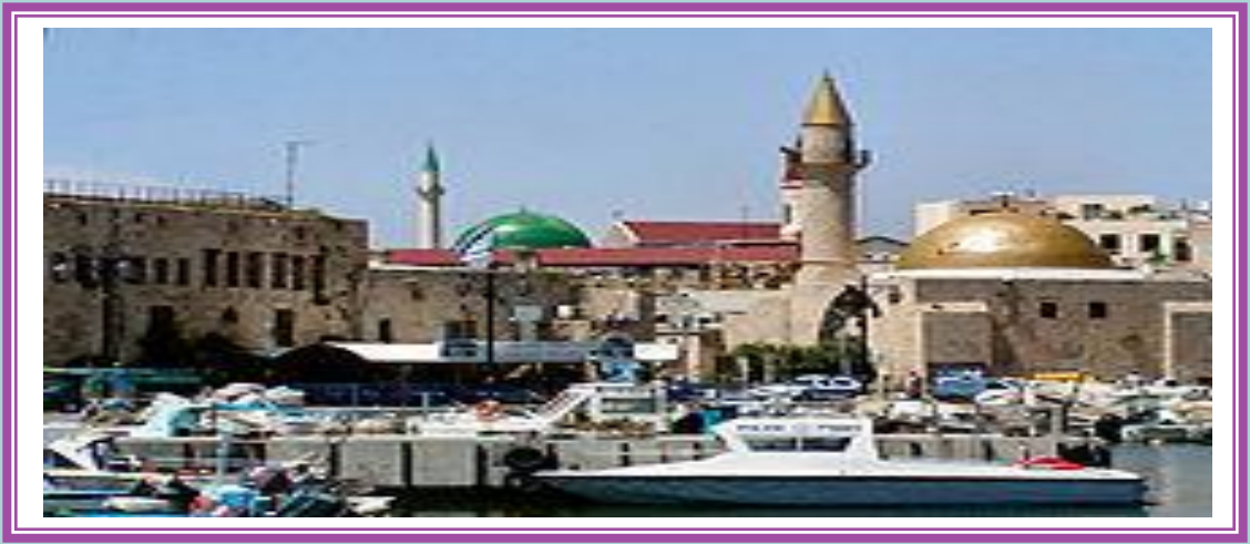
جامع الميناء مدينة عكا