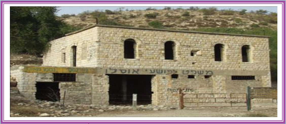
مسجد عين الزيتون حوله الصهانية لحظيرة أبقار